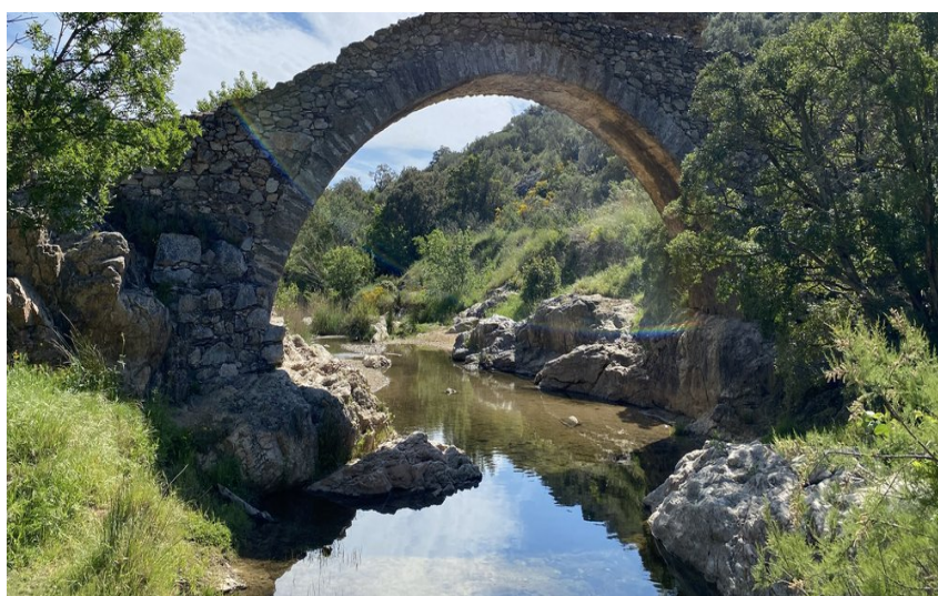
Pont en pierres apparentes enjambant une petite rivière entouré de végétation méditerranéenne

À deux pas du village de Grimaud, venez admirer le patrimoine naturel et historique du vallon de la petite rivière « La Garde » avec son Pont des Fées, et le moulin à vent de Saint Roch.