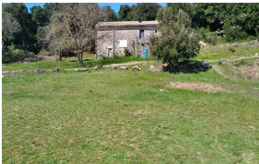
Vue sur une bergerie et sa végétation environnante

Le circuit des bergeries permet à la fois de découvrir un patrimoine bâti ancien utilisé par les bergers, ainsi que les plus beaux points de vue du plateau de Siou-Blanc, grâce à son point culminant à 825 m d'altitude, la Colle de Fède.