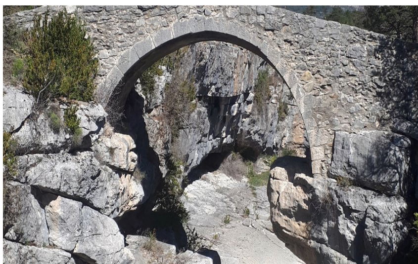
Pont en forme d'arche en pierres du 18ème siècle

Cette randonnée vous fera découvrir le charme d'un village du Haut-Var et ses richesses architecturales, puis, vous entraînera jusqu'au pont de Carajuan, porte d'entrée des merveilleuses Gorges du Verdon.