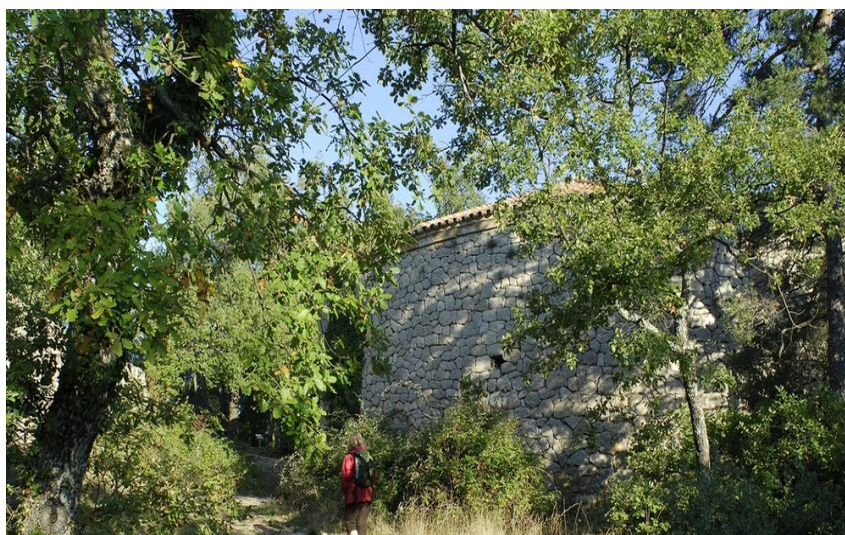
Vue sur la glacière mesurant 23 mètres de haut et de 17 mètres de diamètre

Témoignage d'une activité ancestrale, cette randonnée vous permet de découvrir la glacière Pivaut au coeur de la forêt de Mazaugues.