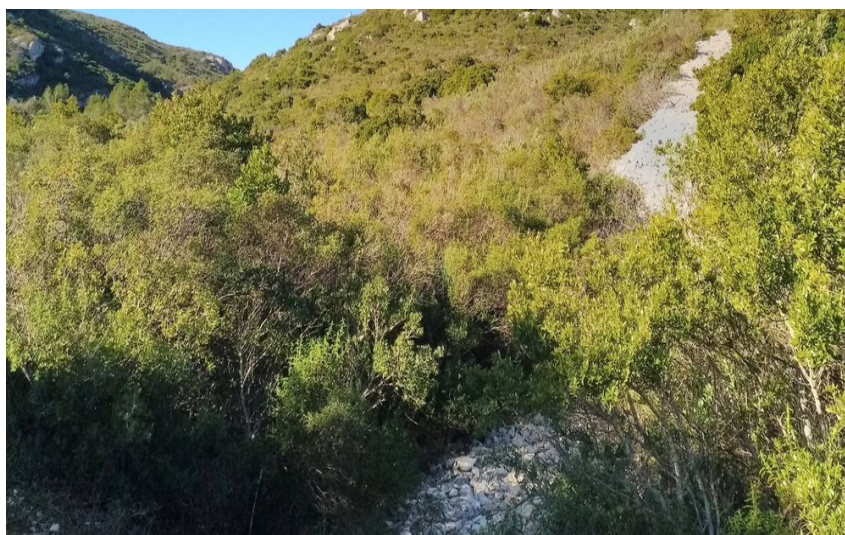
Vue dégagée sur un rocher entouré par la végétation verdoyante

Entre garrigue et maquis, partez à la découverte des anciens fours (à poix, à chaux, à cade) et de la Roche Redonne.