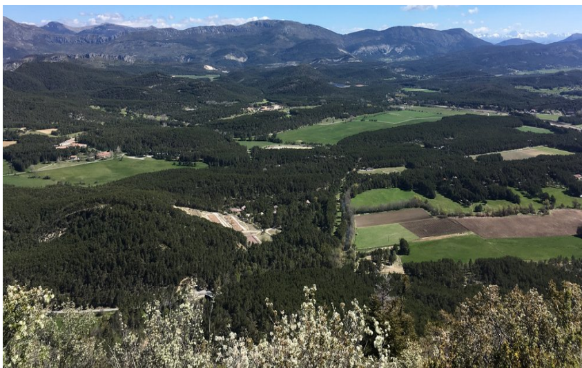
Panorama sur les plaines et les sommets aux alentours du verdon

Délicieuse randonnée qui vous fera découvrir la montagne de Brouis, ses vieilles forêts remarquables, la beauté de ses clairières confidentielles qui alternent avec des paysages ouverts sur les superbes sommets alentours.