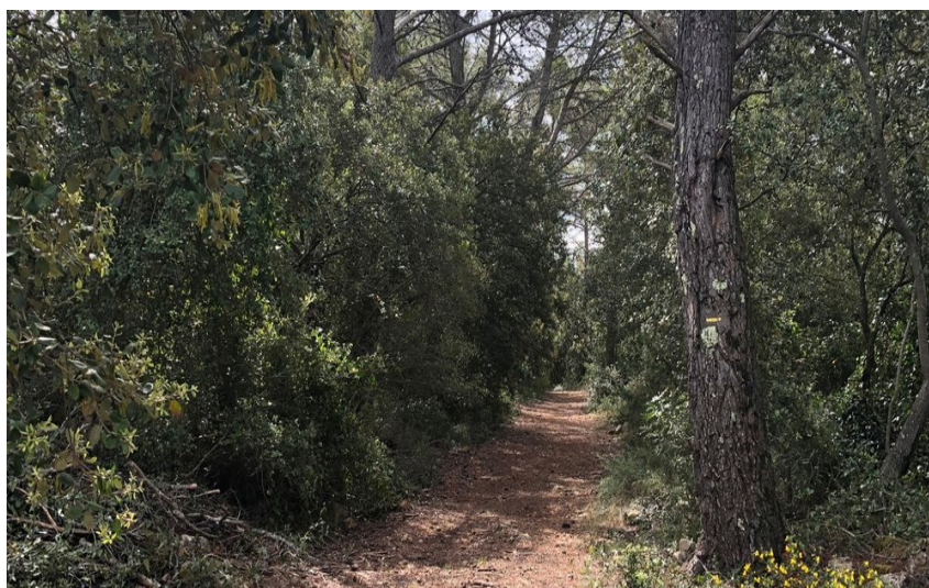
Sentier entouré de végétation dans une ambiance forestière

Circuit de randonnée familial à la découverte du dolmen de Pey Cervier et sa chapelle du XVème siècle.