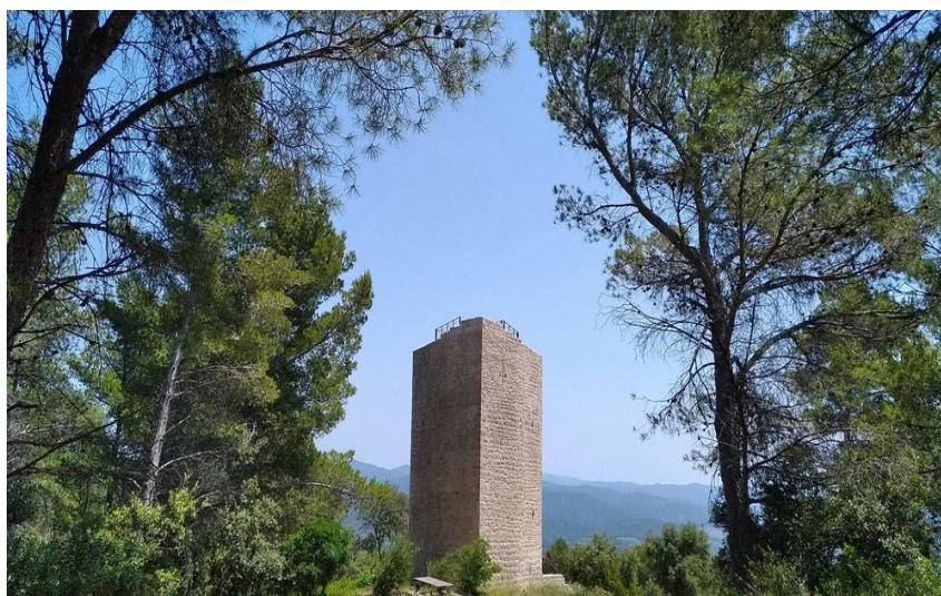
Vue de la tour avec une vue panoramique imprenable

Cet itinéraire vous fera découvrir différentes ambiances, du village de Puget-Ville aux barres de Rocbaron et leurs points de vues panoramiques, en passant par la Tour du Faucon, datant du XII ème siècle.