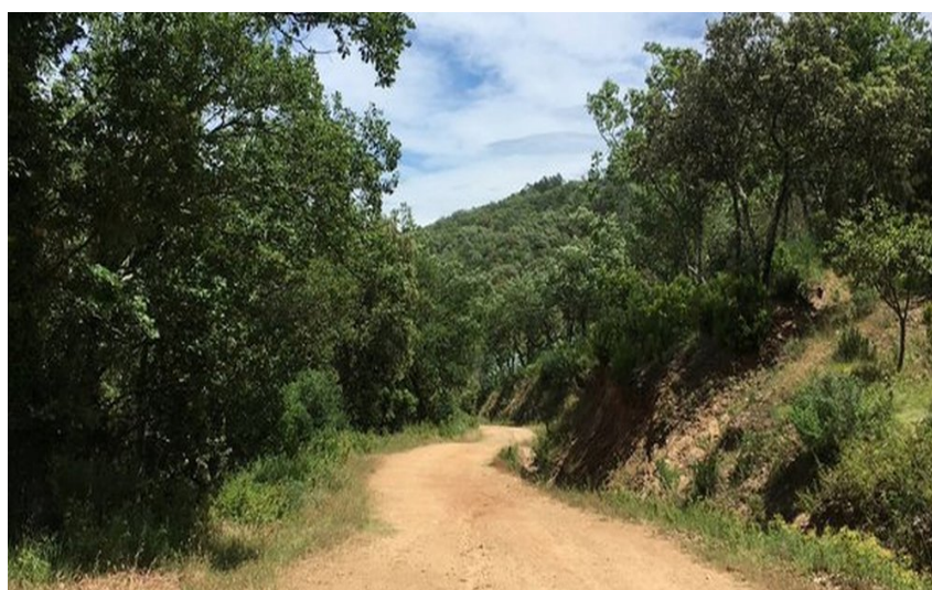
Sentier large avec de la végétation de chaque côté

Ce circuit vous fait passer dans une ripisylve riche et humide dans sa première partie. Puis, vous montez à flanc de colline dans une ambiance chaude et ensoleillée pour découvrir l'Apiè de Raybaud. Au sommet, une vue imprenable vous attend.