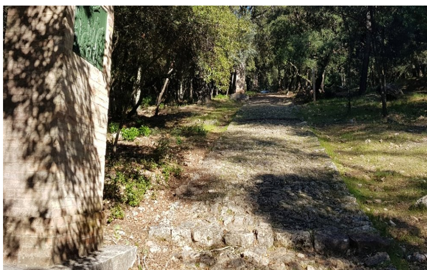
Vue sur les escaliers en pierre cheminant vers le sommet et un oratoire sur la gauche

Petite randonnée à la découverte d'un parcours sportif en forêt et de nombreuses chapelles.