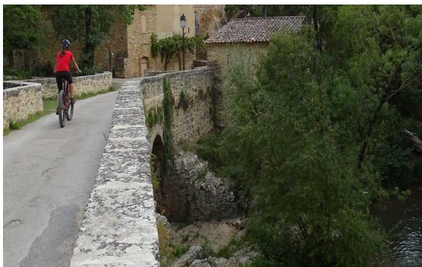
VTTiste roulant sur une route bordée par des murets en pierre, avec une vue sur la rivière en contrebas (GS)

Découvrez le village médiéval d'Entrecasteaux et son château emblématique. Admirez les rives de la rivière de la Bresque et profitez des sentiers ombragés.