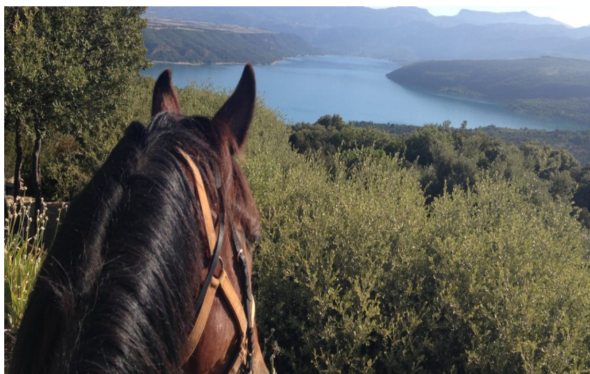
Vue d'un cavalier sur les gorges du Verdon (LL)

Ce circuit est situé dans le Parc Naturel Régional du Verdon. Il traverse les forêts communales d'Artignosc et de Régusse, composées de résineux et de feuillus. Il offre de superbes panoramas sur le Verdon.