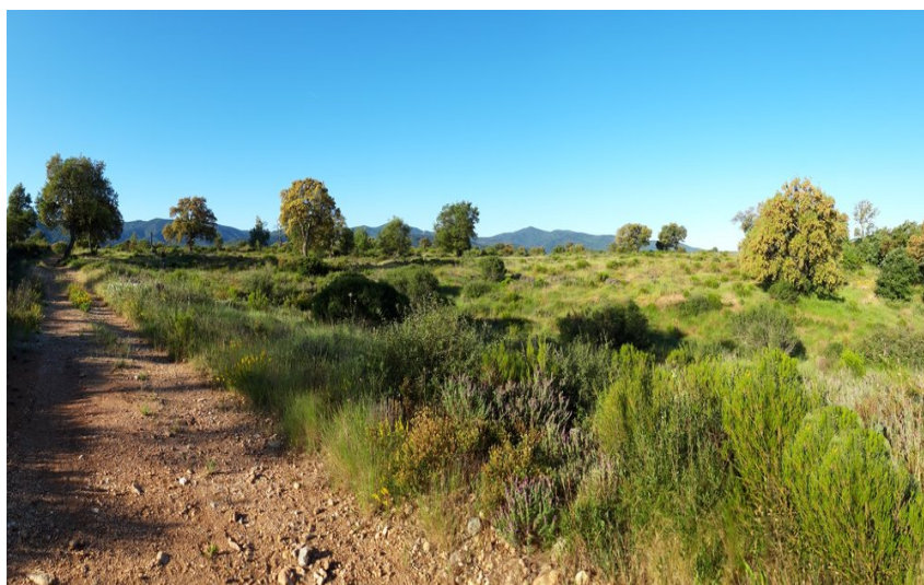
Vue sur la végétation de la plaine des Maures

Ne vous fiez pas au nom de cette randonnée. Elle va vous emmener à la découverte d'une variété de terrains et de paysages, à toute allure, et vous tomberez sous le charme du Massif des Maures.