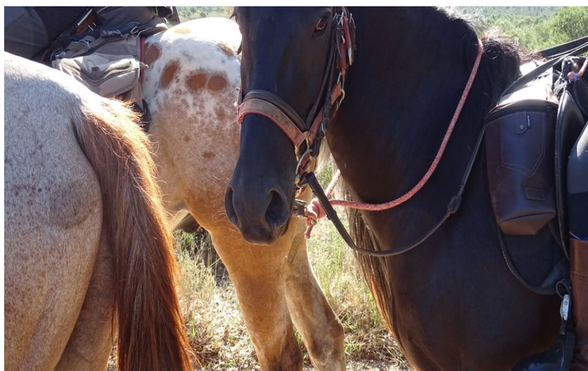
Vue sur la tête d'un cheval

Partez à la découverte d'un territoire unique en France avec une biodiversité exceptionnelle, et un paysage de grande valeur.