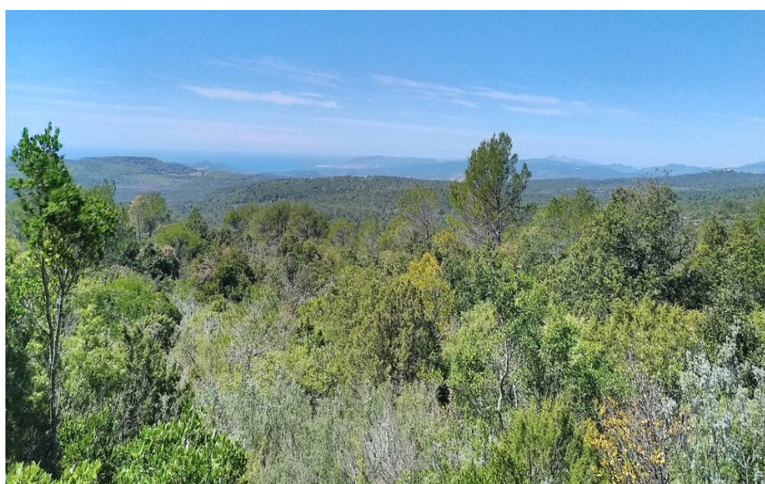
Panorama sur la végétation verdoyante et les collines environnantes

Plongez dans la garrigue provençale pour découvrir des points de vue remarquables et ses curiosités géologiques typiques du plateau de Siou Blanc.