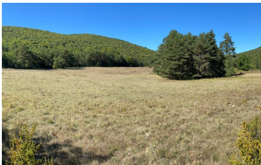
Vue sur une doline entourée de végétation

Venez découvrir une des plus grandes dolines d'Europe, formée naturellement par l'effondrement de la roche.