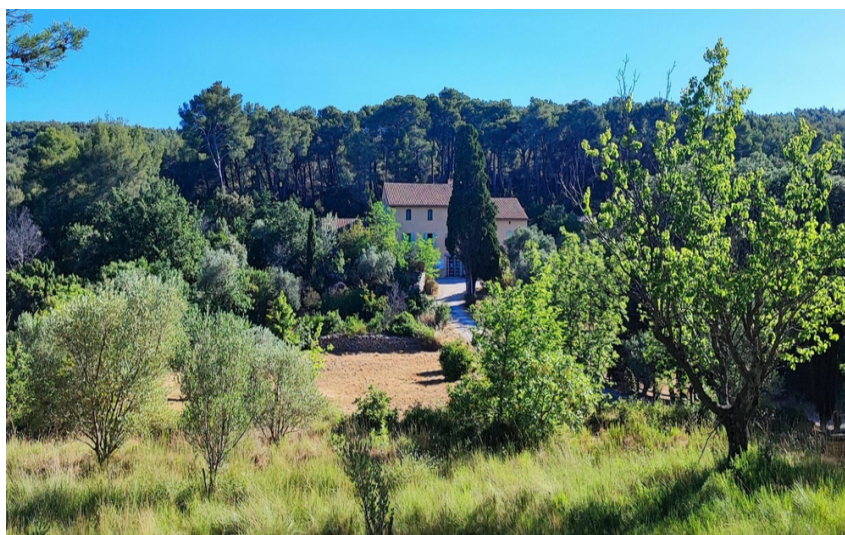
Vue sur la Maison de la Nature posée dans un écrin de verdure

Partez à la découverte de l'Espace naturel sensible des Quatre frères et sa Maison de la nature, où les traditions et les anciens métiers de la colline reprennent vie.