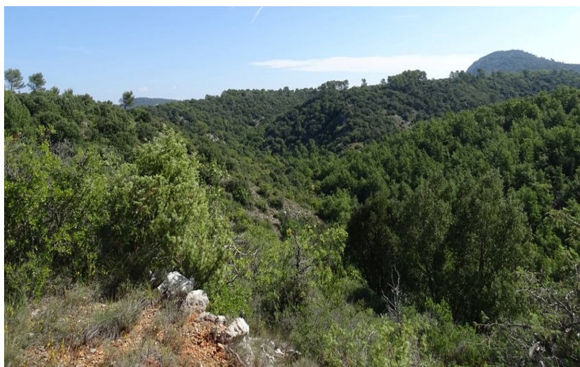
Panorama sur les collines et la végétation verdoyante

Partez à la découverte de la forêt communale de Rians, en parcourant les sentiers sur d'anciennes traces d'activités forestières. Le pastoralisme, les charbonnières et les vieilles restanques en pierres sèches témoignent de la vie du temps jadis.