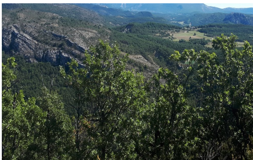
Panorama sur le sommet du Monthiver avec les barres rocheuses Les Baumes et la montagne du Lachens en arrière plan

Cette petite randonnée vous fera découvrir l'Espace naturel sensible (ENS) de Siounet, remarquable pour ses points de vue sur les massifs du Verdon, les Alpes du Sud et les villages de Comps-sur-Artuby et Trigance.