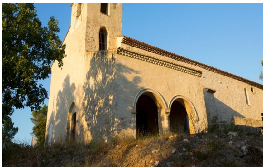
La Chapelle Sainte-Auxile

Cette randonnée vous séduira par la diversité de ses paysages, ses passages à ambiance forestière, son patrimoine culturel, notamment la chapelle Sainte-Auxile qui offre une vue panoramique sur la plaine agricole.