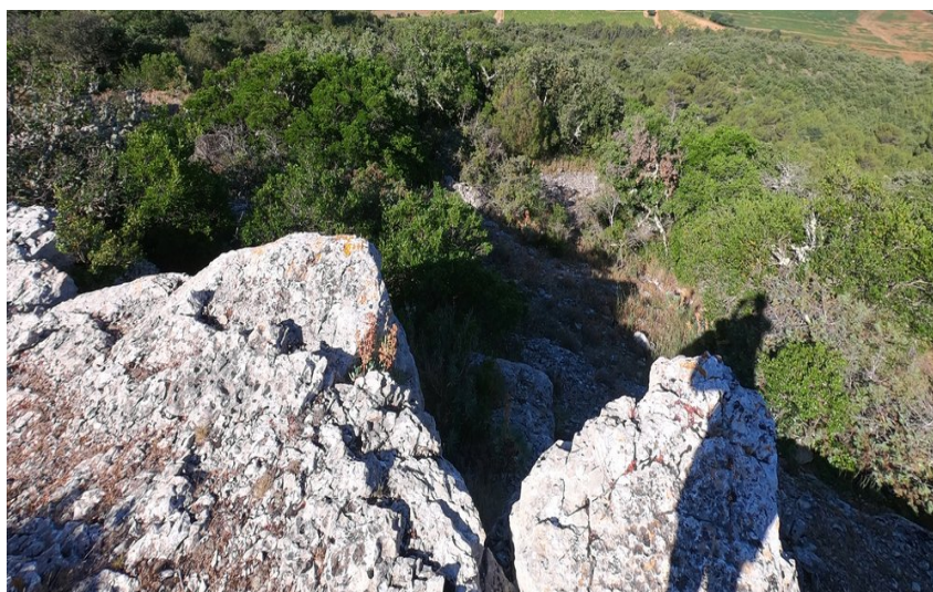
Panorama sur la vallée et les collines et sommets environnants

Petite ascension pour découvrir le grand oppidum du II e siècle avant JC du Mont Major.