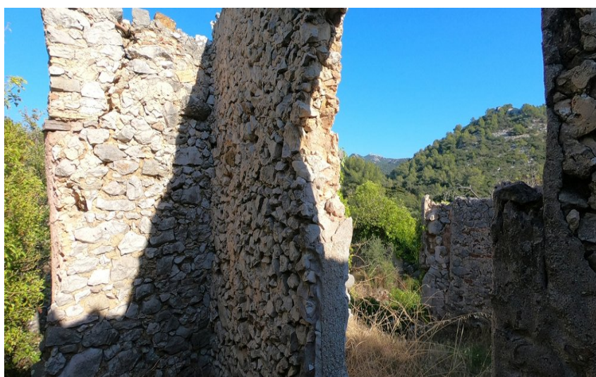
Vestige d'une habitation en pierres

Venez découvrir le château de Tourris et ses environs au travers de cette belle randonnée aux multiples histoires et paysages.