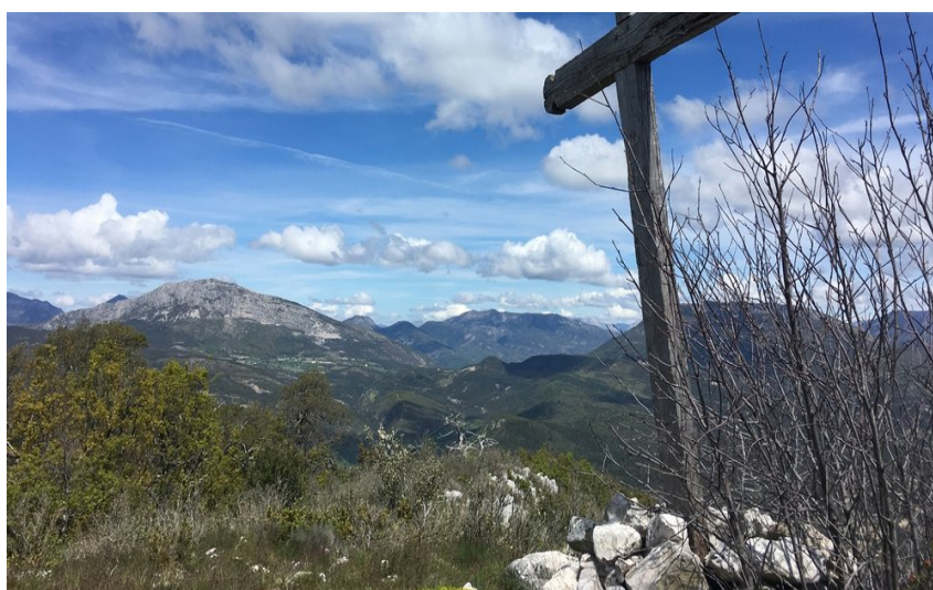
Panorama du sommet sur les collines de Clare avec la présence d'une grande croix en bois

Cette randonnée qui conduit au sommet de la forêt domaniale de Clare (1 260 m d'altitude) offre une vue magnifique sur les Préalpes et des forêts où se mélangent espèces alpines et méditerranéennes.