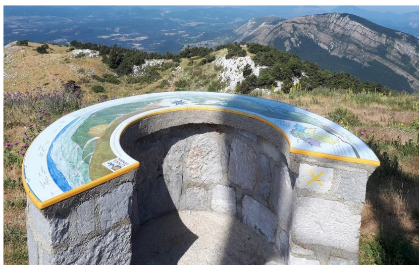
Table d'orientation avec vision à perte de vue sur les collines environnantes

Randonnée sportive pour accéder au point culminant du Var (le mont Lachens à 1 714 m d'altitude) et découvrir différentes facettes de la haute Provence avec un panorama exceptionnel. À réaliser en dehors de la période hivernale.