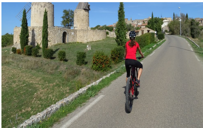
Cycliste sur route goudronnée avec en deuxième plan les 2 moulins en pierres à l'entrée d'un pré

Ce périple à 2 roues vous fait découvrir les gorges du Verdon et profiter d'une vue à 360° sur les crêtes de Baudinard-sur-Verdon, en passant par des sentiers à travers les forêts de chênes.