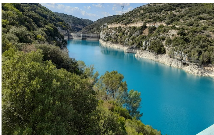
Vue sur le barrage, les berges calcaire et les eaux turquoise du lac entouré de végétation méditerranéenne

À la croisée de la Provence et des Alpes, venez découvrir des paysages et villages d'exception au cœur du Parc naturel régional du Verdon. À votre rythme, vous pourrez programmer vos étapes afin de réaliser un grand circuit de plusieurs jours.