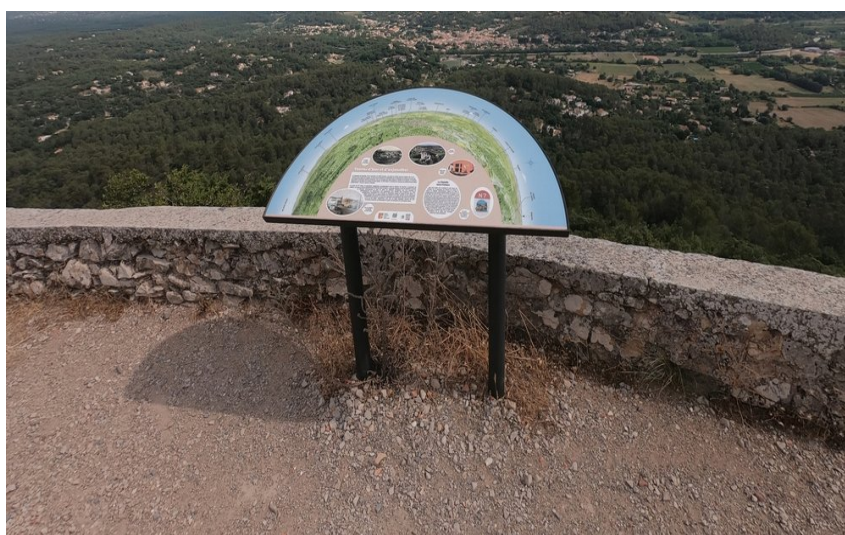
Table d'orientation décrivant le panorama côté nord-ouest

À deux pas du village de Tourves, découvrez la chapelle Saint-Probace, son sentier en sous-bois jalonné d'oratoires et une vue remarquable sur le village et les massifs environnants.