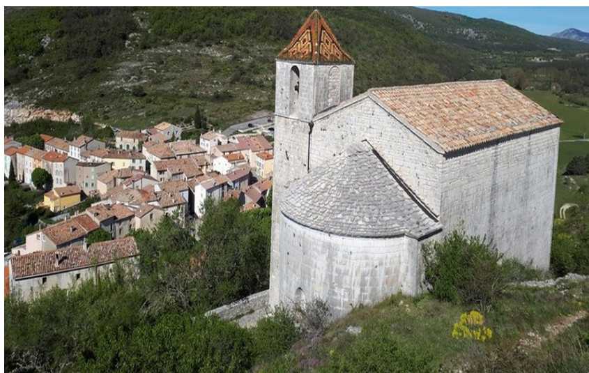
Vue sur le clocher de la chapelle St-André et le village de Comps sur Artuby en contrebas

Partez à la découverte d'un patrimoine naturel varié allant des forêts de chênes blancs aux belles hêtraies qui accueillent une biodiversité remarquable.