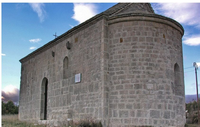
Vue sur l'arrière de la chapelle en pierre avec une petite croix en fer

Au départ de Comps-sur-Artuby, randonnez au cœur du haut Verdon avec vue sur le Lachens, le plus haut sommet du Var.