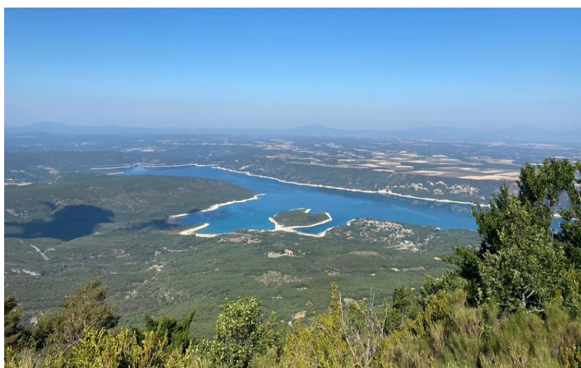
Vue du sommet du grand Margès sur le lac de Ste Croix , le plateau de Valensole, les grandes gorges du Verdon et Canjuers

Au départ du village d'Aiguines, réalisez l'ascension du troisième plus haut sommet du Var et profitez de sa vue à 360°.